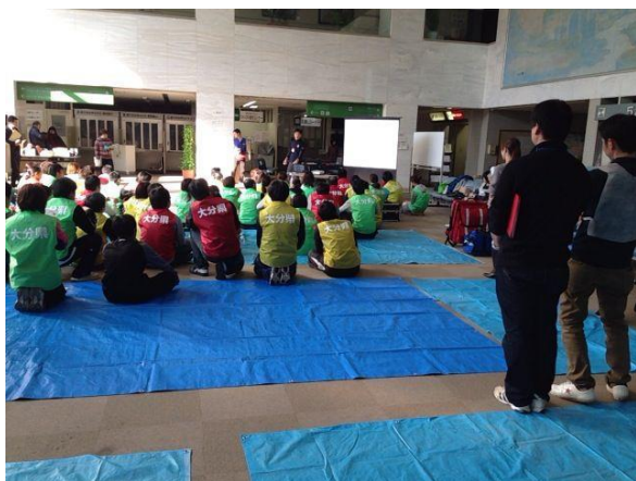
大分 DMAT 研修の様子