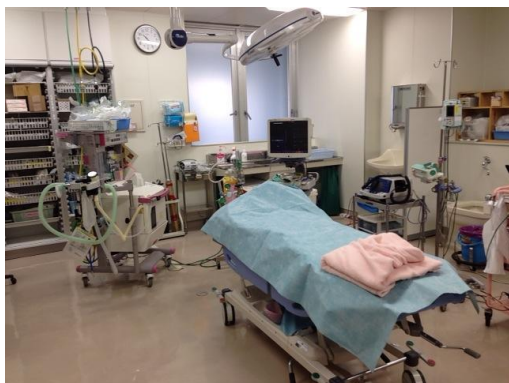
救命救急センター初療室の様子