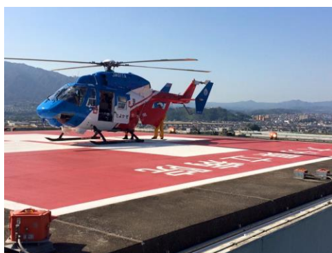
大分県防災ヘリを用いた転院搬送の様子

病院所属のドクターカーに加えて平日日勤帯は大分市消防局の救急車が常駐し派遣型救急ワークステーションとなっています。