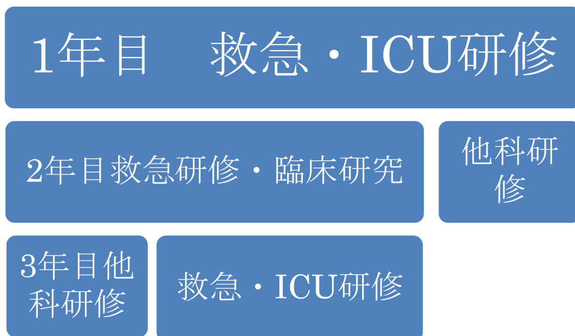
図2 プログラムの概要