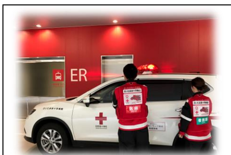
令和4年度ドクターカー実績