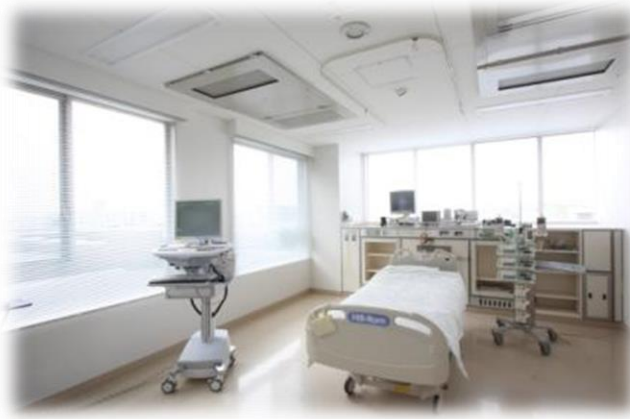
★ICU 8床 開放的