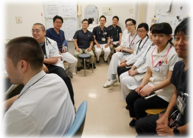
★ある朝のカンファレンス