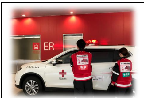
令和7年度ドクターカー実績